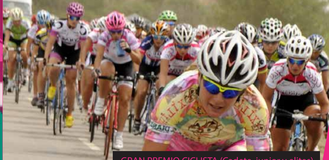
GRAN PREMIO CICLISTA (Cadete, junior y elites)