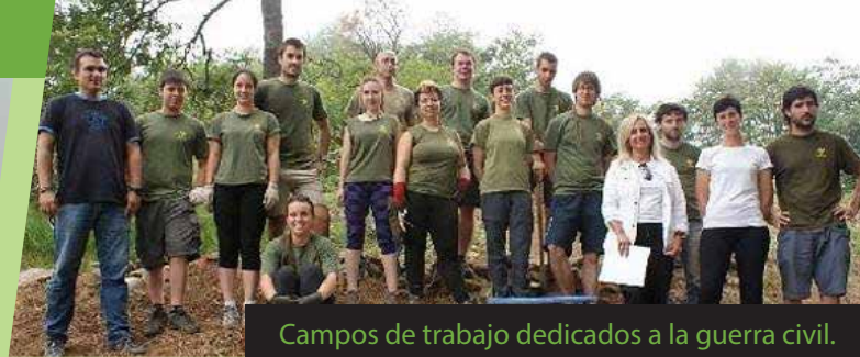
Campos de trabajo dedicados a la guerra civil.